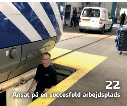
22 Ansæt på en succesfuld arbejdsplads