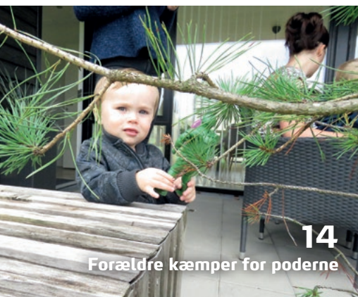
14 Forældre kæmper for poderne