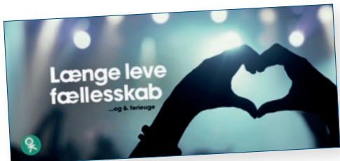
Vejen til varigt job 31